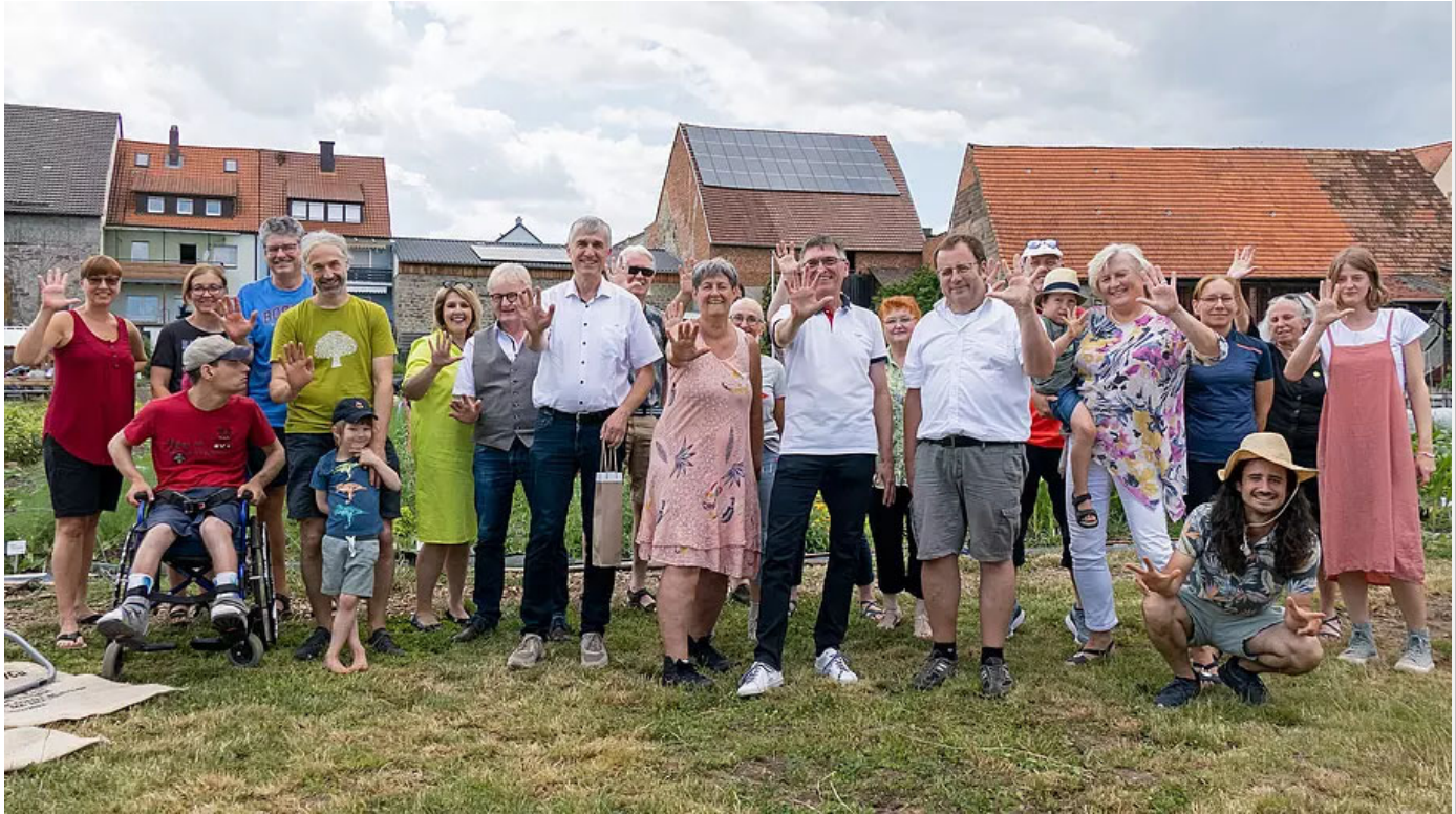
Fünf Finger für fünf Jahre erfolgreiche SoLaWi.