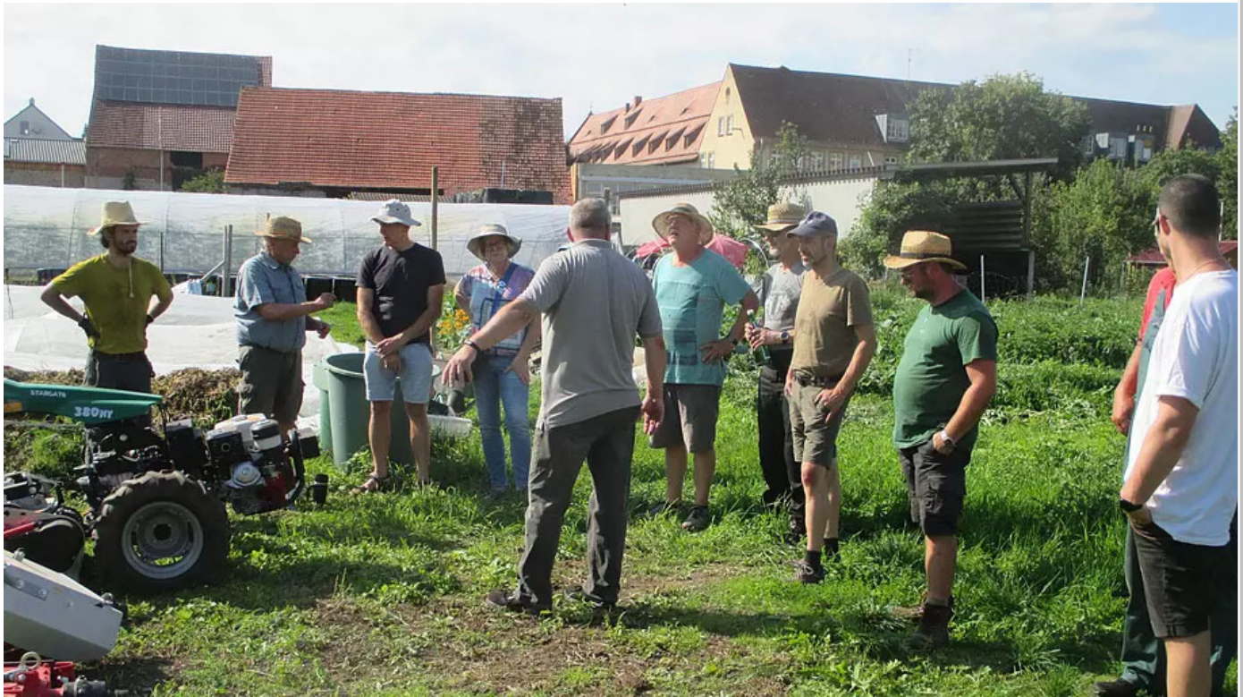
Fachleute und Interessierte bei der Gerätevorführung für schonende Bodenbearbeitung.